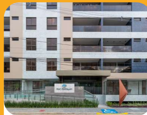
Eco Oceania (2021) Residencial