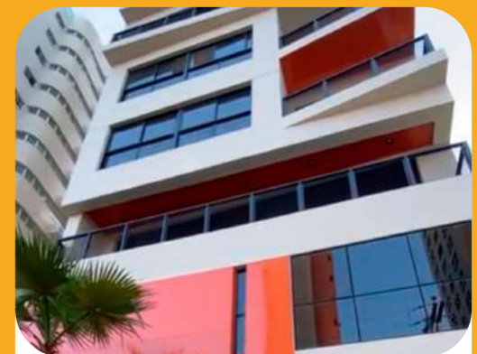
Eco Fit (2022) Residencial