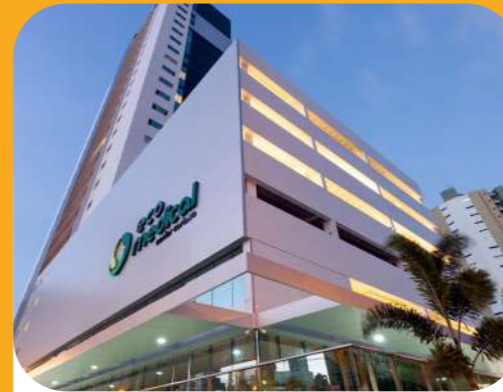
Eco Medical Center (2014) Empresarial

Por isso, ao longo dos anos, cada projeto desenvolvido e cada obra entregue levaram não apenas o nosso nome, mas, também, a Paraíba adiante.