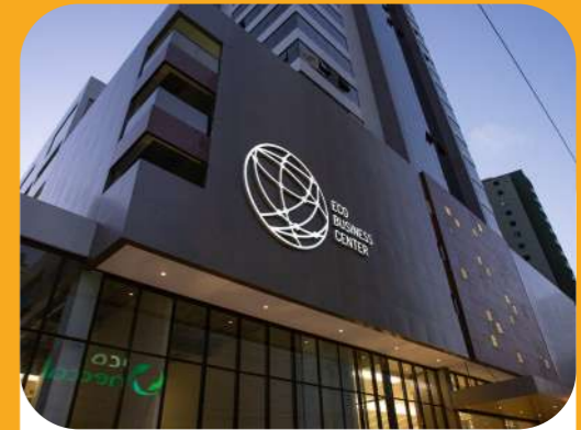
Eco Business Center (2018) Empresarial